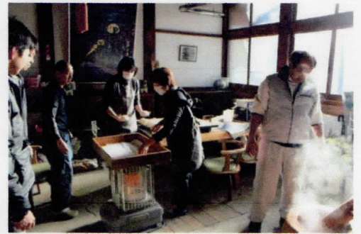
御供え餅をたくさん作りました