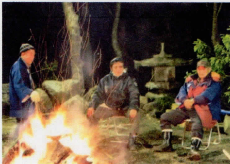
総代・世話人さん達がたき火の番をしてくださいました

12月31日から元旦にかけて、「除夜の鐘」を撞いております。総代・世話人さん達が見守る中、今年もたくさんの方々が鐘を撞きにこられました。除夜の鐘が鳴り始めると一年の終わりと新しい一年の始まりを実感できるような気がします。鐘を撞いた後は、忍野の厳しい寒さに負けず、風邪をひかないように、たき火の前で「おすいとん」と「甘酒」を食べていただきました。さまざまな世代の方が一つの火を囲んで暖まる様子は、どこか家庭的で和やかな雰囲気につつまれていました。