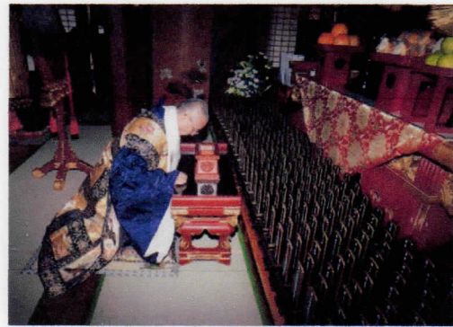
天台宗のお坊さん6名にお手伝いいただき、 総勢8名にて法要を執り行いました。

小春日和の穏やかな天候に恵まれ、恒例の『お会式』が11月3日に行われました。『お会式』とは天台・伝教両大師に対する報恩感謝と東円寺檀信徒のご先祖に感謝する行事です。時代とともに、やり方は様々ですが、昔から受け継がれている大切な1日です。今年も檀信徒の皆様にご参加いただき、和やかな内無事に終えることが出来ました。ありがとうございました。