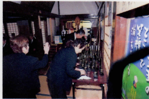
ご先祖様のお位牌のお掃除をされる方々。